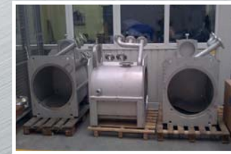
Svařování + obrábění