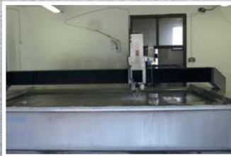
CNC vysokotlaký řezací stůl PTV 4000 x 2000