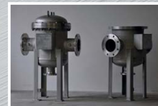
Nerezové tlakové nádoby