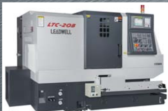
CNC soustruh Leadwell LTC 20B