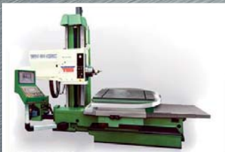
CNC horizontální frézování a vyvrtávání WH 10 CNC