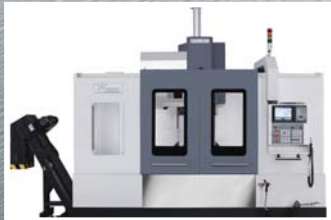
CNC obráběcí centrum Akira Seiki SV 1350