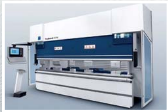
CNC ohraňovací lis Trumpf Trubend 5170