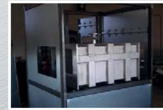
Svařování + obrábění