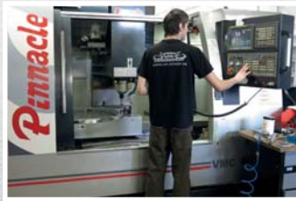
CNC obráběcí centrum Pinnacle VMC 1100S